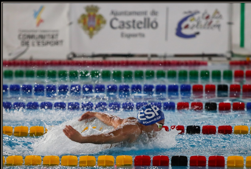
Piscina Municipal Olímpica de Castellón 25 m - 10 calles. Cronometraje electrónico Omega Quantum

El comité organizador tiene el honor de invitarles al XXI Trofeo Internacional Castalia Castellón, TICC24 . Son ya 21 años organizando este destacado trofeo y como cada año, queremos que los deportistas sean el centro del espectáculo. Esta edición se celebrará en piscina de 25m, con el objetivo de mantener la sintonía del calendario de eventos nacional e internacional. Esperemos cumplir con vuestras expectativas y que este TICC24 este cargado de éxitos.